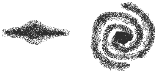
Unsere Milchstraße Schematische Ansicht von der Seite und von oben

Nach neuesten Forschungen müssen wir davon ausgehen, dass unser Weltall mindestens 100 Milliarden Milchstraßensysteme oder Galaxien ähnlich unserer Heimat-Galaxis enthält!